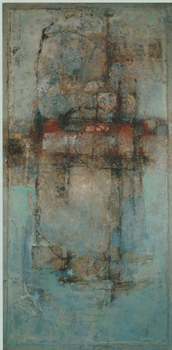
Terug in het blauw boven de alles omringende klei

Onderweg is een mooi begrip want dat zijn we allemaal of we nu reizen of thuiszitten. In eindeloze uren en jaren die later momenten blijken te zijn. Cees Nooteboom beschrijft in het nawoord van zijn laatste gedichtenbundel op een prachtige manier hoe het terug komt in zijn werk. Hij start met een onderwerp maar dan slaan zijn gedachten een andere weg in. "Beelden uit een ver verleden dat nooit is verdwenen." Hij beschrijft hoe het gedicht een eigen wending neemt en hoe hij al fragmenten had genterd voor het gedicht er was.