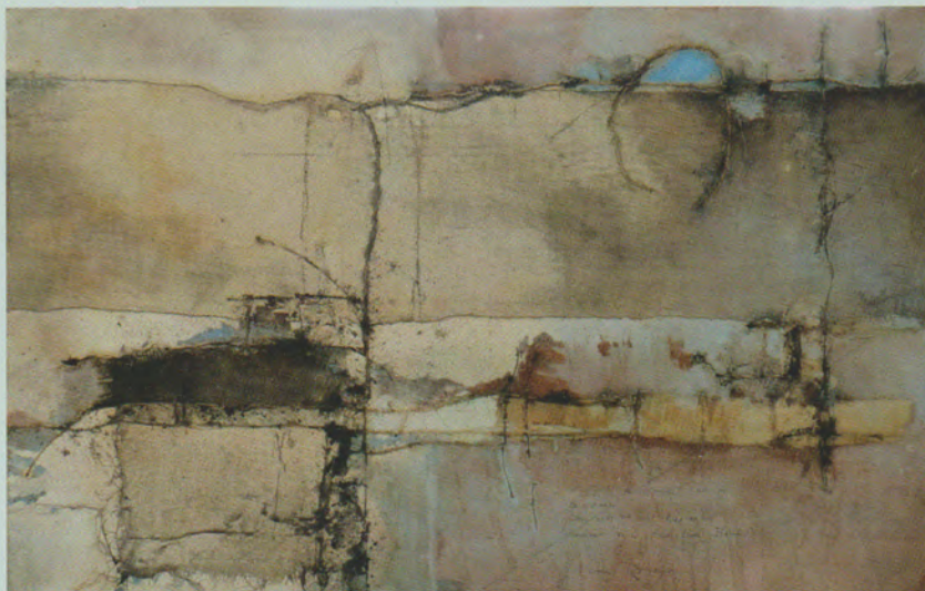
Om iets te vinden en te behouden van wat we niet hier en nu kunnen zijn ( fragment uit gedicht van Wilma Beun)